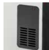
Salida de aire forzado TLS-503T