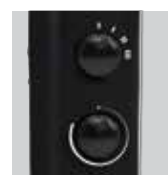
Termostato automático regulable y selector de potencia